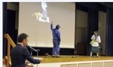
▶ 社協職員による寸劇