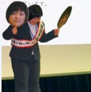
社協職員による事業紹介

第13回八峰町社会福祉大会が、去る平成30年11月9日、200名を超える福祉関係者、来賓にご出席いただき、ファガス・文化ホールにおいて開催されました。