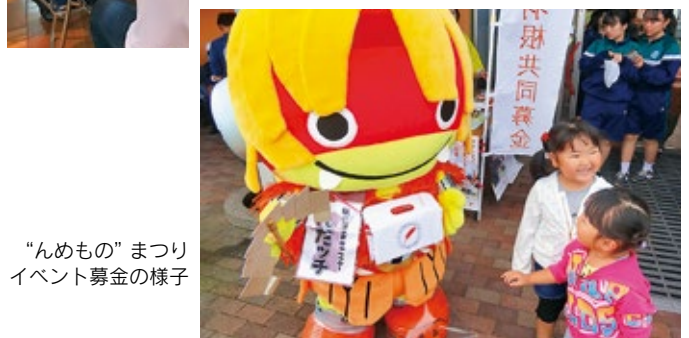
“んめもの”まつり イベント募金の様子