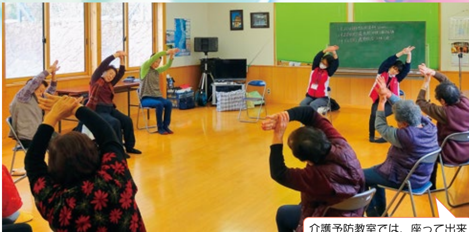
介護予防教室では、座って出来る体操や脳が活性化するようなゲームをしています。