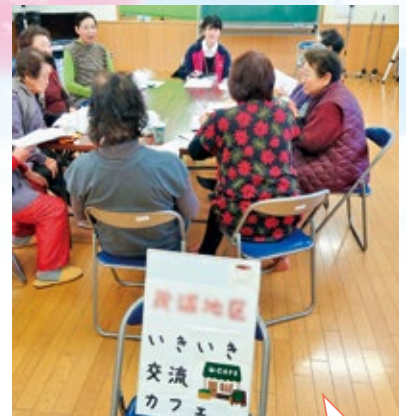
いきいき交流カフェでは、認知症予防につながるように地域の馴染みの方と和やかな話っこをしています。