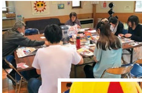
のんき会の皆さんから、配布物の仕分けに協力してもらいました。