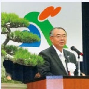
生活支援コーディネーターが配選 しています。