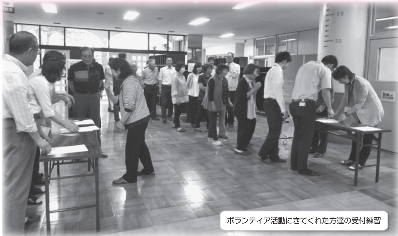
ボランティア活動にきてくれた方達の受付練習