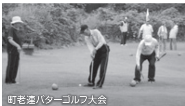
町老連バターゴルフ大会