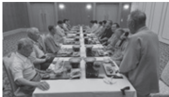
毎年企画している一泊研修旅行に行ってきました。会員同士の親睦もさらに深まりました。

八峰町在住で、身体障害者手帳をお持ちの方であれば、どなたでも町協会の会員になることができます。