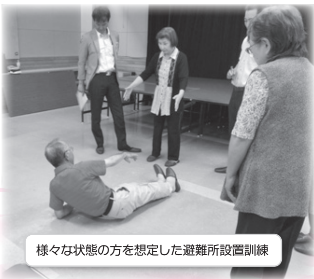
様々な状態の方を想定した避難所設置訓練