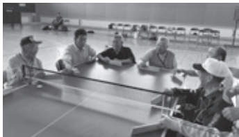
三種町立体育館で開かれた県北地区のスポーツ教室に参加しました。卓球パレーとボッチャを体験しました。

八峰町身体障害者協会では、毎年、県の身体障害者福祉協会が実施する事業への参加をはじめ、スポーツ、レクリエーション、研修旅行や相談支援等、地域の実情を踏まえながら会員や地域住民のために事業を実施しています。