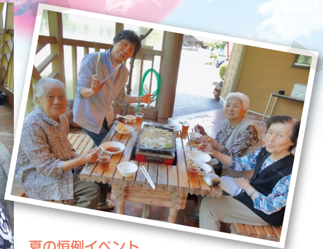
夏の恒例イベント ぶなっこランドでのバーベキュー