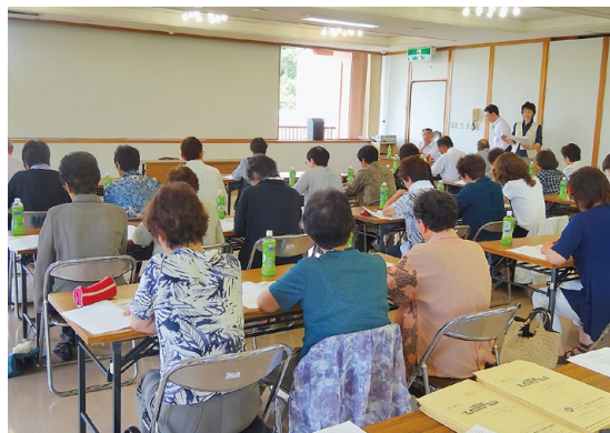
6月23日に開催した『福祉員合同研修』

この度、各自治会長さんのご協力を得て、八森地区に26名、峰浜地区に34名の福祉員さんを決定しましたので、皆様にご紹介いたします。