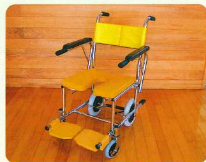
シャワーキャリー