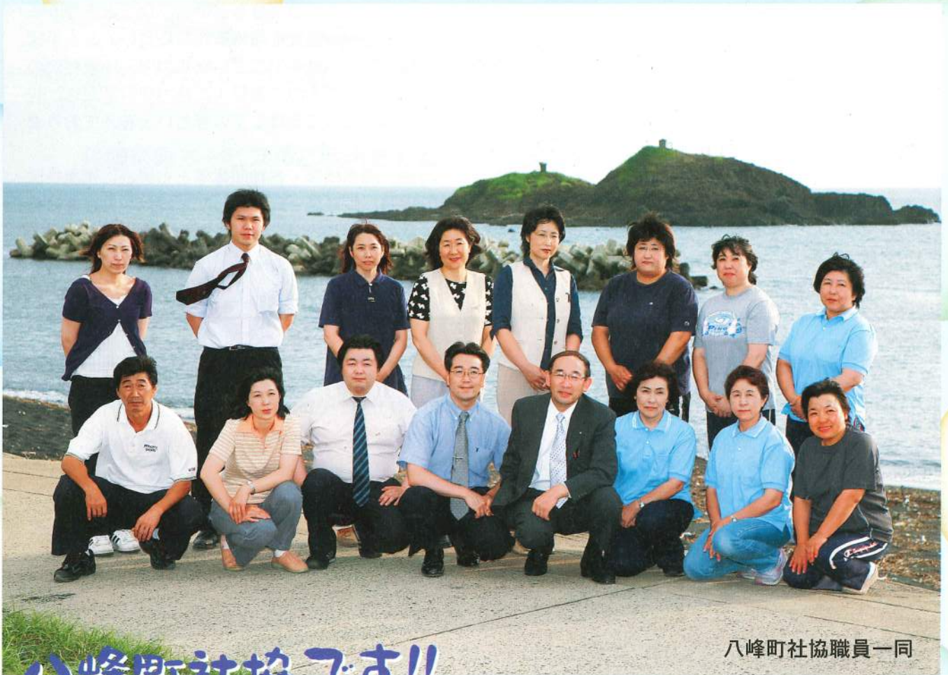
八峰町社協職員一同

平成18年7月25日発行 発行/社会福祉法人 八峰町社会福祉協議会 〒018-2637 秋田県山本郡八峰町八森字 家の後6番4 TEL・FAX 0185-77-3318