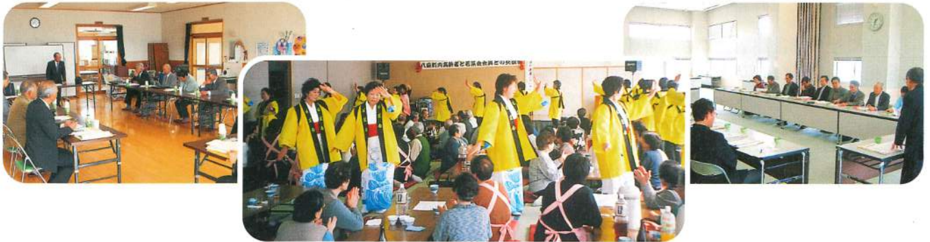
ボランティアグループ若菜会と 高齢者の交流会