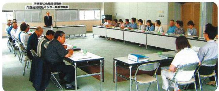
第1回八森地域福祉センター福祉懇談会