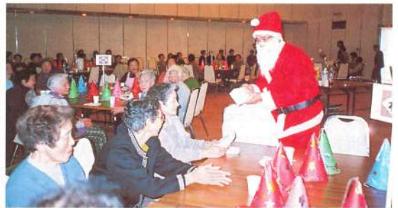
▶クリスマス会でサンタさんからプレゼント