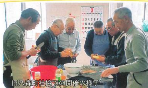
旧八森町社協での開催の様子