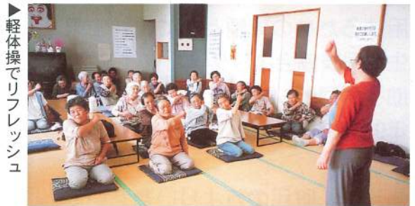
▶軽体操でリフレッシュ