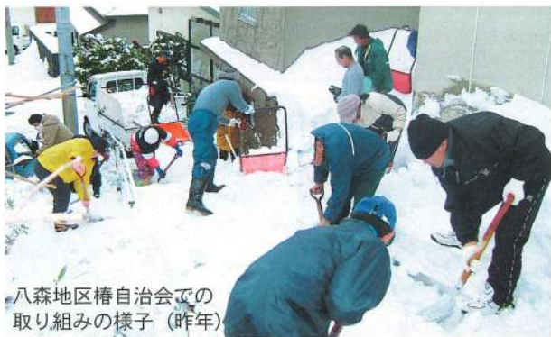
八森地区椿自治会での取り組みの様子(昨年)

除雪に関して個人では解決できないような場合には、使用できる制度等のご相談にのりますので、社協までご連絡ください。