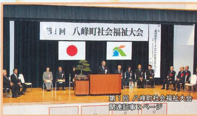
第1回 八峰町社会福祉大会 関連記事2ページ

平成19年1月25日発行 発行 社会福祉法人 八峰町社会福祉協議会 〒018-2637 秋田県山本郡八峰町八森字 家の後6番4 TEL・FAX 0185-77-3318