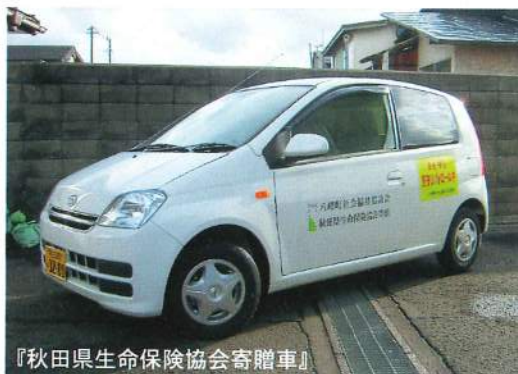
『秋田県生命保険協会寄贈車』

地域福祉活動においては、迅速に行動しなければならないような様々な場面がありますので、ご寄贈いただきました車輻及び善意の寄付金で購入させていただきました車輻を、安全運転で有効に活用させていただき、さらなる地域福祉の向上を目指していきたいと思っております。