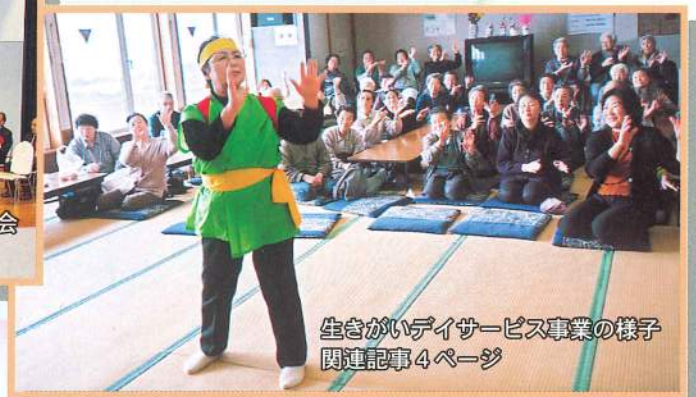
生きがいデイサービス事業の様子 関連記事4ページ