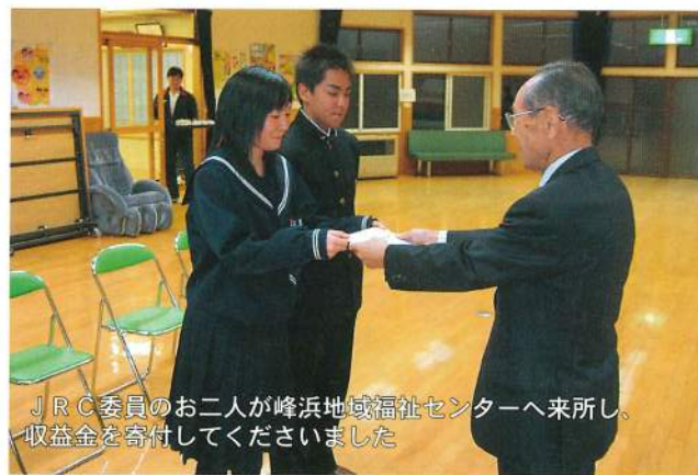
JRC委員のお二人が峰浜地域福祉センターへ来所し、収益金を寄付していただきました

ご寄付いただきました収益金につきましては、町内にお住まいの在宅介護者の負担軽減を目的として、貸し出し用の介護用ベットを購入させていただく予定としております。