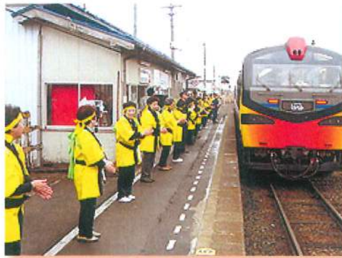
リゾートしらかみの岩館駅停車とハタハタ館改修開店のためのセシモニーに参加できて、本当によかった、よかった。