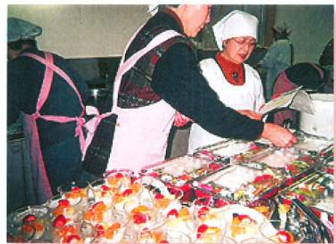
どうかな、おいしく食べてくれるといいけど。今回は、色どりもいいぞ。(福祉担当)