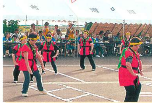
新しくそろえた半天きて白神ばやし踊ったども、楽しく力強く白神山地の様子でてたかな？(海光苑 納涼祭)