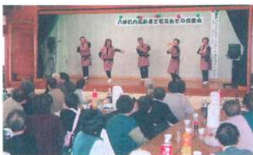
町内高齢者と若菜会との交流会