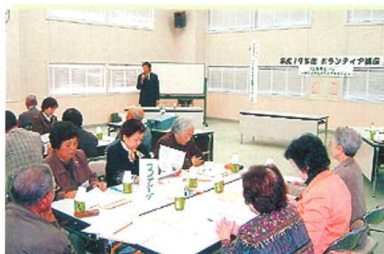
被災地の現状と課題を生々しく語っていました。