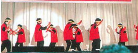
舞台も広いし、控室も広いし使いやすかったな。参加した人又手伝いをしてくれた人達ごろうさんでした。(文化祭 峰栄館)