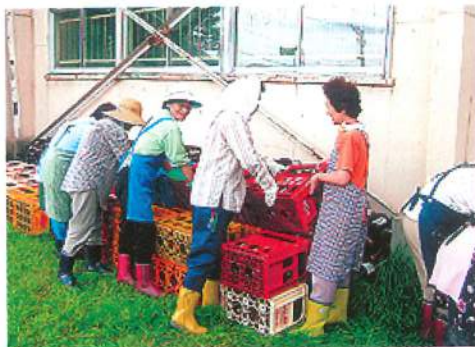
朝、雨降りそうであったのに天気上がってえがったな。空ビンもえっぺ協力してもらって、ありがとう。（19年9月）