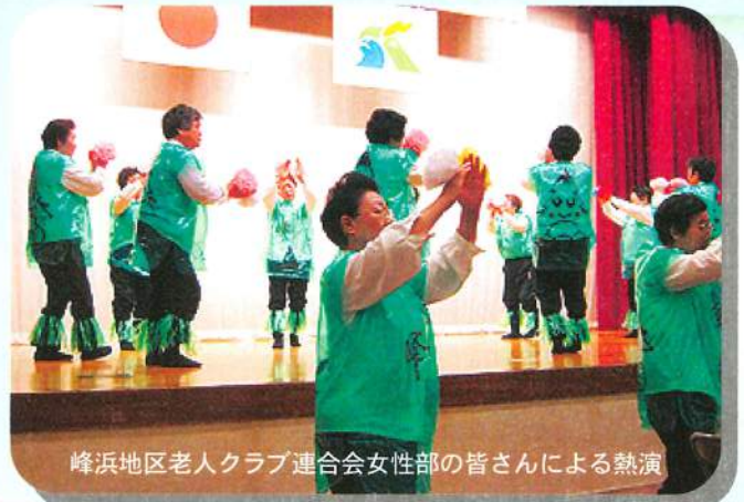
峰浜地区老人クラブ連合会女性部の皆さんによる熱演