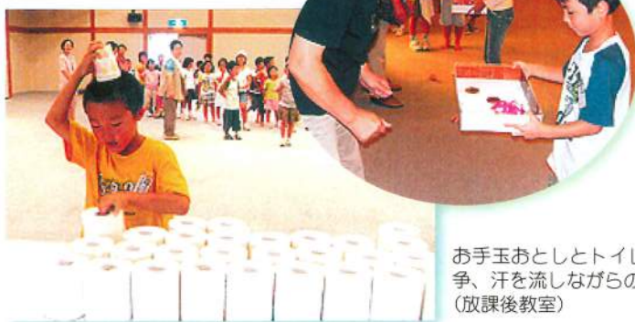
お手玉おとしとトイレトペーパー交換競争、汗を流しながらの運動楽しそうでした。(放課後教室)