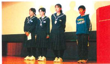
体験発表をされた皆さん

参加者の皆さんは、福祉の担い手としての決意を新たにし、福祉のまちづくりには住民の主体的参加が不可欠であることのご理解をいただきました。