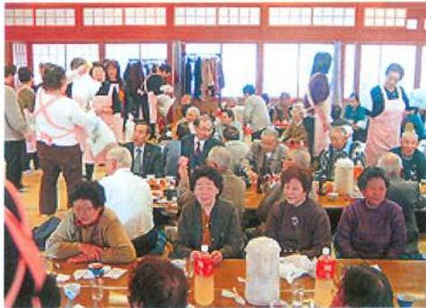
交流会に峰浜からも参加してもらってえがったな、みんな喜んでもらってありがたい。(19年3月交流会・白神温泉)