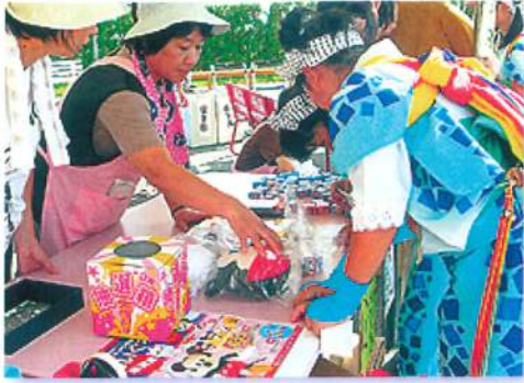
商売繁盛ですね、あせを流しながらの納涼会のお手伝いもたのしいね。(海光苑 納涼祭)