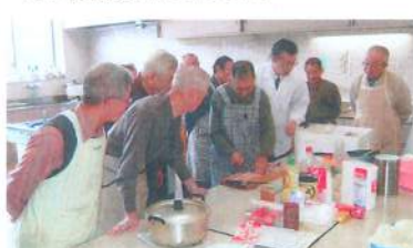
高齢世帯の男性料理教室