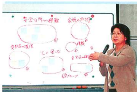
グループを代表して発表しています。