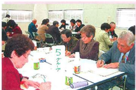
学生に戻ったように真剣です。