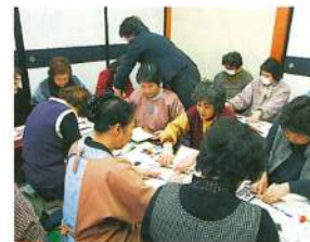
目名湯地区では22名の参加がありました。

各自治会館を会場に、町保健師と在宅福祉相談員と一緒に訪問し、健康についてや困りごと、悩み事などへの相談に応じるとともに、福祉サービスの紹介を行いました。