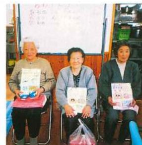
何歳になってもうれしいお誕生会