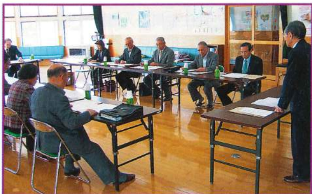
社会福祉協議会 理事会