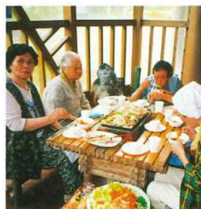
みんな大好きバーベキュー (ぶなっこランドにて)