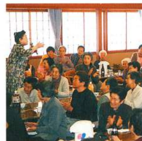
梅丸たまごショーで大笑い