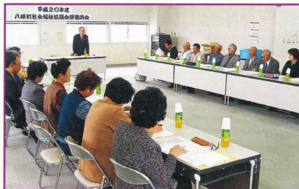
社会福祉協議会 評議員会