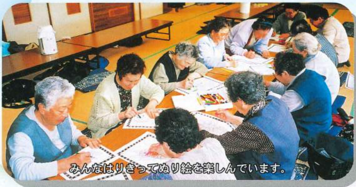
みんなはりきってぬり絵を楽しんでいます。