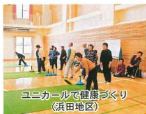
ユニカールで健康づくり (浜田地区)

社会から孤立した方をなくし、地域住民がふれ合うための活動です。介護予防教室やカラオケ、趣味創作活動など、地域住民が主体となって活動を行っています。