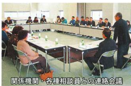
関係機関・各種相談員との連絡会議