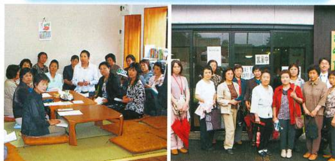
福祉員によるふれあいいきいきサロン 『まめだ屋』(美郷町六郷地区)の視察研修