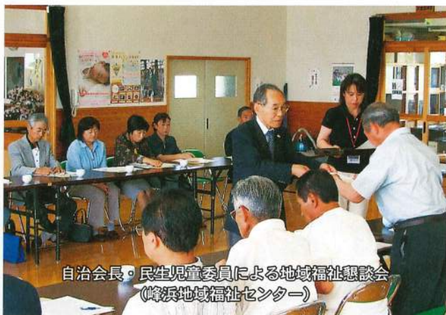
自治会長、民生児童委員による地域福祉懇談会 (峰浜地域福祉センター)