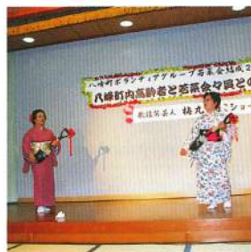
若菜会会員による演芸

いきいき・ふれあい活動の一環として、地域住民参加型による事業をボランティアグループ若菜会と共催により行っています。20年3月27日に開催された交流会(於 あきた白神温泉ホテル)は、若菜会結成20周年記念のお祝いも兼ねて実施されました。