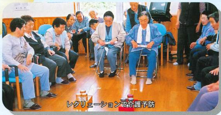
レクリエーションで介護予防

平成20年7月25日発行 発行 社会福祉法人 八峰町社会福祉協議会 〒018-2637 秋田県山本郡八峰町八森字 家の後6番4 TEL・FAX 0185-77-3318