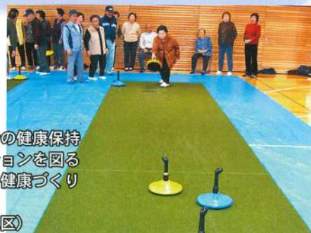
冬期間における高齢者の健康保持増進とコミュニケーションを図るため、ニュースポーツ健康づくり事業を実施します。 (写真は峰浜・堀川地区)