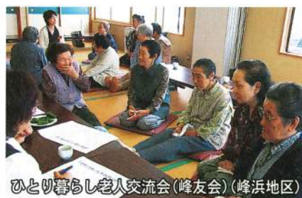
ひとり暮らし老人交流会(峰友会)(峰浜地区)