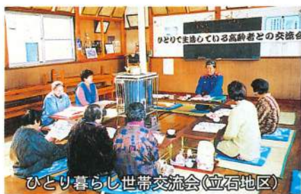
ひとり暮らし世帯交流会(立石地区)

このような状況の中、八峰町社会福祉協議会ではすべての町民の生活の質の向上と地域福祉活動に取り組むきわめて公益性の高い社会福祉法人として「だれもが住み慣れた地域で安心して暮らせる豊かなまちづくり」のための事業を一層推し進め、関係機関との連携強化を図り、住民参加によるボランティア活動を促進し、利用者本位の福祉サービスや支援体制の確立、緊急時の要援護者の支援体制の確立など各種福祉事業に積極的に取り組み、地域福祉並びに在宅福祉活動の推進に一層取り組んでいきます。