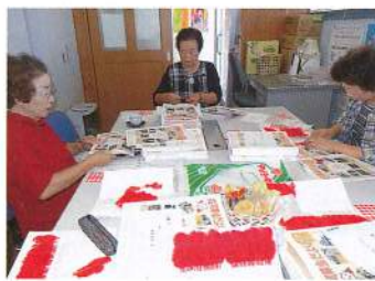
ボランティアグループ若菜会・会員5名の方が全戸配布用の「赤い羽根」と「共同募金だより」の準備をして下さいました。

募金合計額 1,719,075円 ※目標額 1,770,000円 (達成率 97.1%)