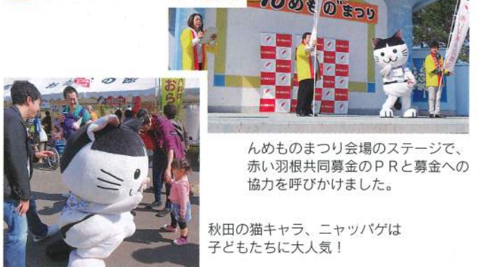
んめものまつり会場のステージで、赤い羽根共同募金のPRと募金への協力を呼びかけました。