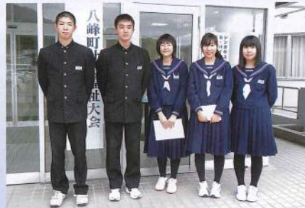
福祉体験学習の成果を発表した 八森中学校3年生の皆さん