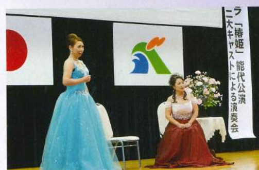
▲ミニコンサートのようす