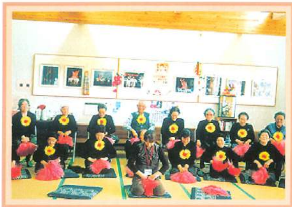
まずはお辞儀からしっかりとね。 (文化祭練習/湯っこランド)