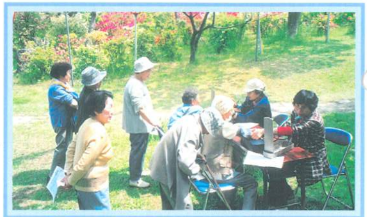
青空の下で血圧測定です。いつもありがとう。 (つつじ見物／能代公園)