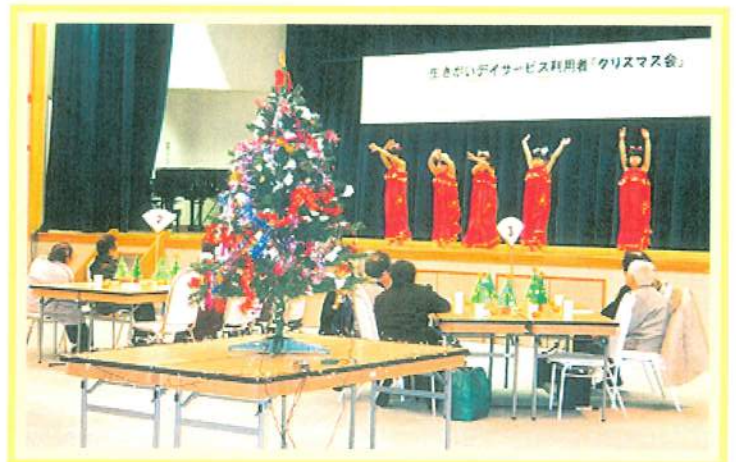
観海こども園園児による可愛らしいダンスに拍手喝采。 (クリスマス会/ファガス)