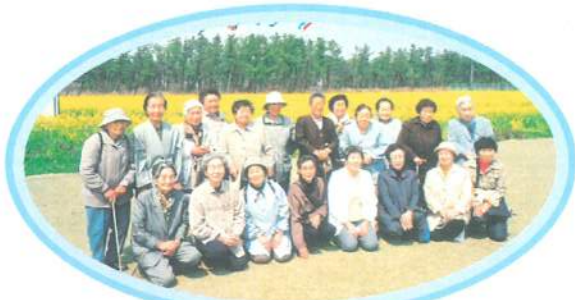
見ごたえのある菜の花畑に感動しました。 (観桜会／サンルール大瀧前)

生きがいデイサービス事業では、実行委員が主体となり、個人・団体の各種ボランティアの方々よりご協力をいただきながら、年間計画に基づいた月毎の各種行事を行っております。