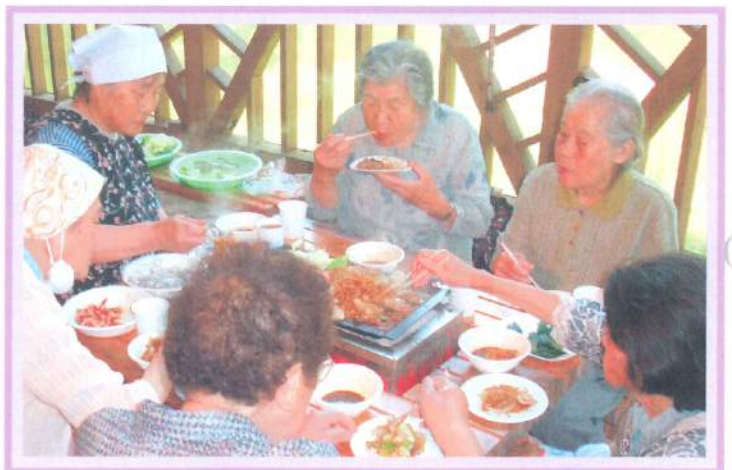
いつもペロリと残さず食べます。 (バーベキュー／ぶなっこランド)