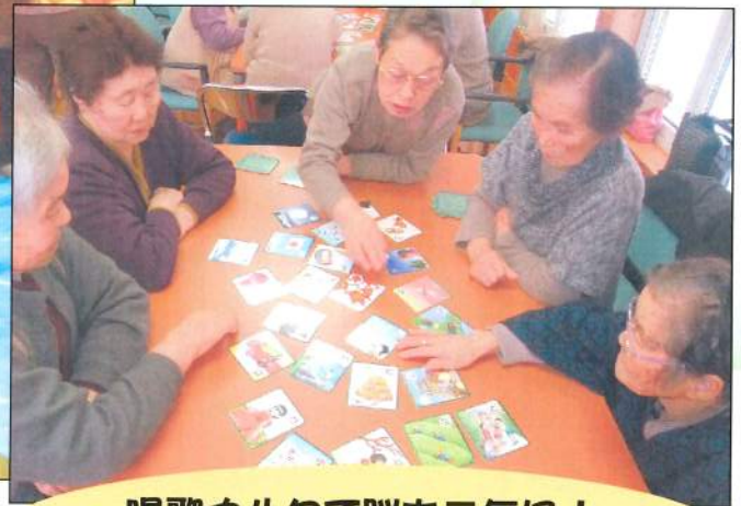
唱歌カルタで脳も元気に! (1月14日・生きがいデイサービスにて)