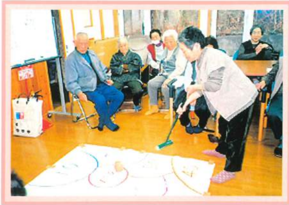
手作りゲームで大いにハマります。 (室内ゲーム/湯っこランド)