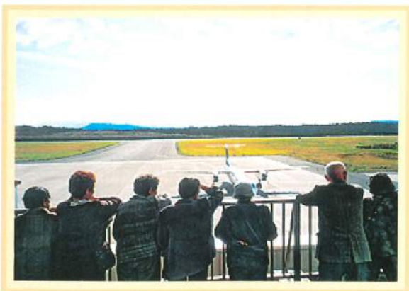
飛行機を間近で見て大興奮！ (一泊旅行/大館能代空港)