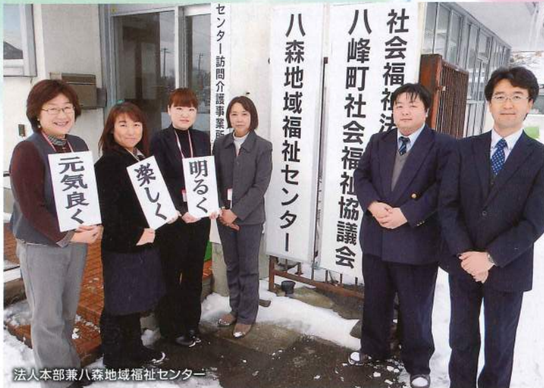
法人本部兼八森地域福祉センター

〒018-2637 秋田県山本郡八峰町 八森字家の後6番4 TEL・FAX 0185-77-3318