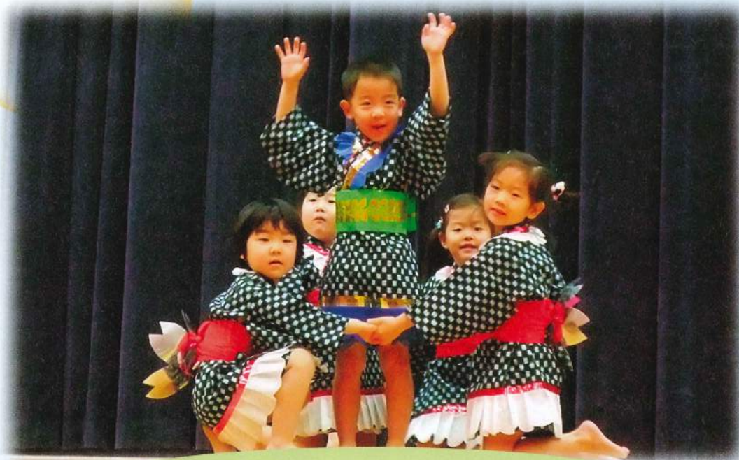
生きがいデイサービス・クリスマス会にて

平成23年1月25日発行 発行／社会福祉法人 八峰町社会福祉協議会 〒018-2637 秋田県山本郡八峰町八森字 家の後6番4 TEL・FAX 0185-77-3318