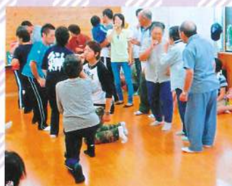
立石自治会大運動会