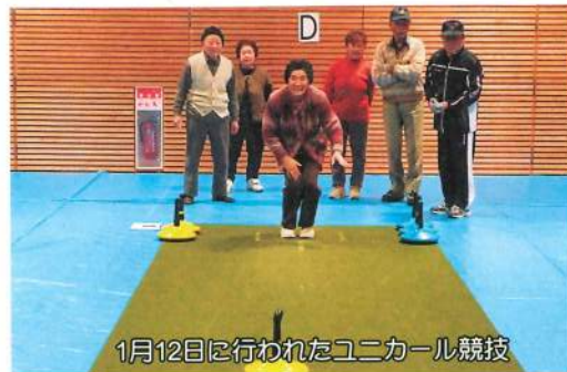
1月12日に行われたユニカール競技

参加対象者は町内老人クラブ会員及び、老人クラブ会員の呼びかけにより参加を希望される方としています。気軽に楽しみながら、健康づくりと仲間づくりをしてみませんか？