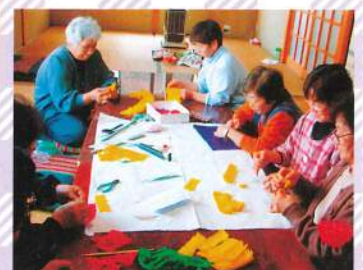
強坂・彼岸花づくり交流会