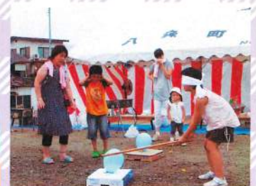
樺台自治会世代間交流会