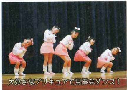
大好きなプリキュアで見事なダンス!

ボランティアの方々が腕をふるった昼食をおいしくいただいた後は、サンタクロースさんからのプレゼントや楽しいゲーム、宝引きなどで大いに盛り上がりました。来年もまた元気で参加しましょうね。