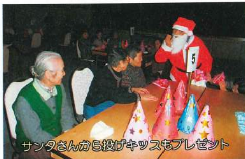
サンタさんから投げキッスもプレゼント