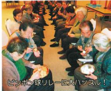
ピンポン球リレーに大ハッスル!