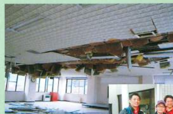
余震で崩れた天井

八峰町社協では、第3回目として7月28日から8月2日まで職員を派遣することにしています。県内外から来るボランティアが、安心安全に活動できるよう支援していくことが、社協職員にとってとても重要な任務であると考えています。