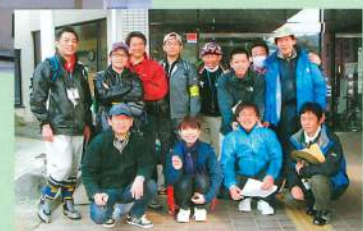
災害ボランティアセンター支援にかけつけたメンバー