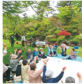
つつじ見学で軽体操

対象者：65歳以上の方で、介護認定において非該当となり、ある程度自分の事ができる方であれば利用することができます。