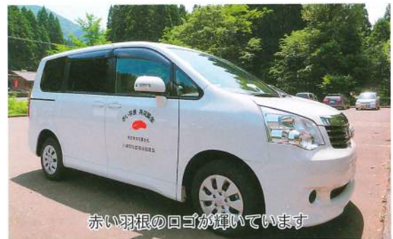
赤い羽根のロゴが輝いています