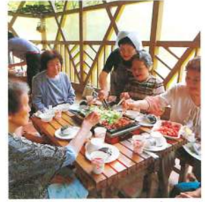
ぶなっこランドでバーベキュー