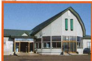
峰浜地域福祉センター (はつらつ苑内)

住み慣れた地域で安心して暮らしたいと誰もが 感じていることではないでしょうか。 地域のこと・福祉のこと、住民の皆さんと一緒に考えながら 共に支えあう福祉サービスを展開しています。