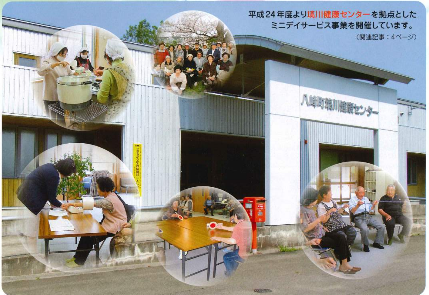
平成24年度より 埴川健康センター を拠点としたミニデイサービス事業を開催しています。 (関連記事：4ページ)

発行 社会福祉法人 八峰町社会福祉協議会 〒018-2637 秋田県山本郡八峰町 八森字家の後6番4 TEL・FAX 0185-77-3318