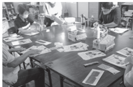
のんき会、カタクリの皆さんが、配布物の仕分けを手伝ってくれました。