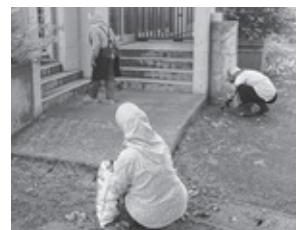
コーラスうららによる施設環境整備(社協事務所周辺の草取り)