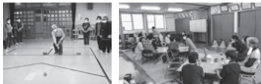
のマークが付いた事業は「赤い羽根共同募金配分金事業」です