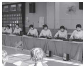
琴修会による演芸披露(社協ミニデイサービス)