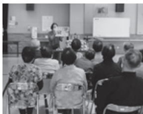
おはなしの会「かもめ」による読み聞かせ(生きがいデイサービス)