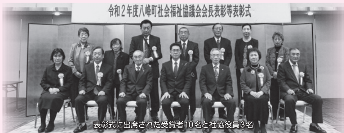
表彰式に出席された受賞者10名と社協役員3名

受賞された皆様、誠にありがとうございました。今後の益々の活躍をご祈念申し上げます。